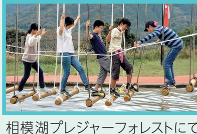
相模湖プレジャーフォレストにて