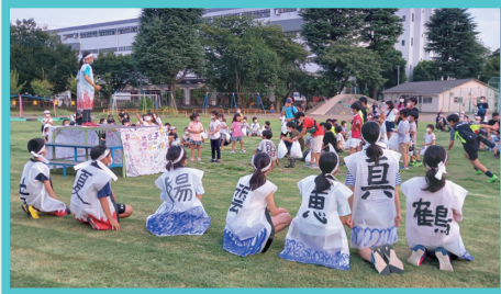
新企画 拝二小ソーランの様子

今回、参加した子どもたちが、未来のリーダーとして成長できる機会になれたらと思います。