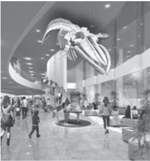
エントランスのイメージ

センターのエントランスに、市内で化石が発見されたアキシマクジラ（学名エスクリクテイウスアキシマエンス）の等身大の化石レプリカをシンボルとして展示することから施設の特徴を表し、親しみやすいとの理由で選ばれました。