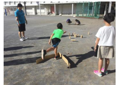
（ミッションガチャの様子）