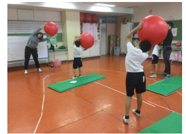
（バランスボールの様子）