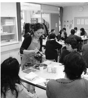
参加延べ人数は108人でした。

◆会場 市立武蔵野会館 普段何気なく飲んでいるお茶の歴史や種類、美味しいお茶のいれ方などを学びました。参加された皆さんは、グループになつてお茶を飲んだり、お菓子を食べたりしながら交流も図りました。