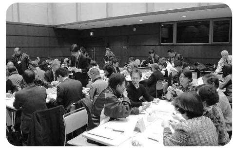
▲昭島市社会教育関係委員研修会の様子

公民館主催事業では事務局より、今後実施される講座等チラシが配付され説明がありました。また、今年度実施した子育てセミナーなどの事業報告があり、委員より費用対効果や広報のあり方などの意見がありました。