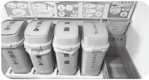
公民館ごみ箱(6月末日現在)

昭島市では、資源として、市民館を推進するために、燃やされる紙類を分別して回収し、資源として再利用できるようにしています。