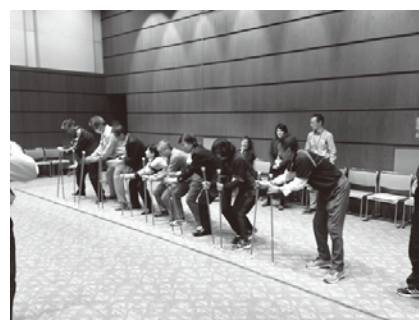
キャッチング・ザ・スティック体験

ティック」「ペア・リング・キャッチ」を体験しました。終了後は懇親会もあり、生涯学習推進のための連携を図る良い機会となりました。