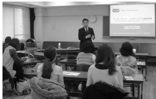
▲地域公民館事業・地域課題講座の様子