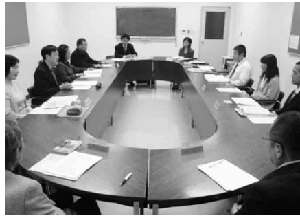
▲ 4月25日の定例会の様子

旨の報告などが事務局よりありました。 そのほか、諮問に係わる答申について、協議がされました。