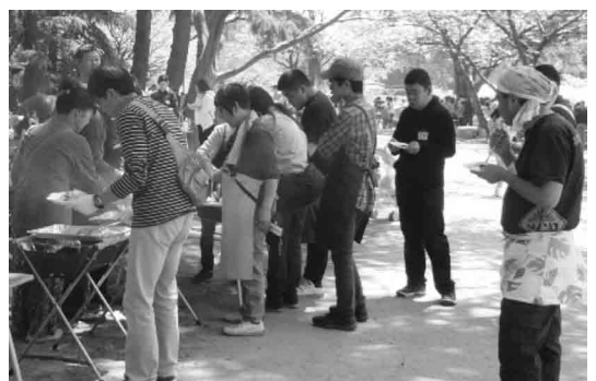
▶開講のつどいの様子

★開講のつどい以降も年間を通して随時参加者を募集しています。障害の有無は問いません。詳しくは公民館までお問い合わせください。