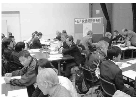
▲社会教育関係委員研修会の様子