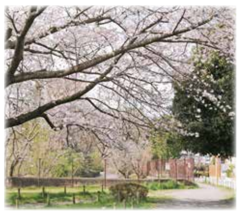
水辺に咲く (玉川上水付近)