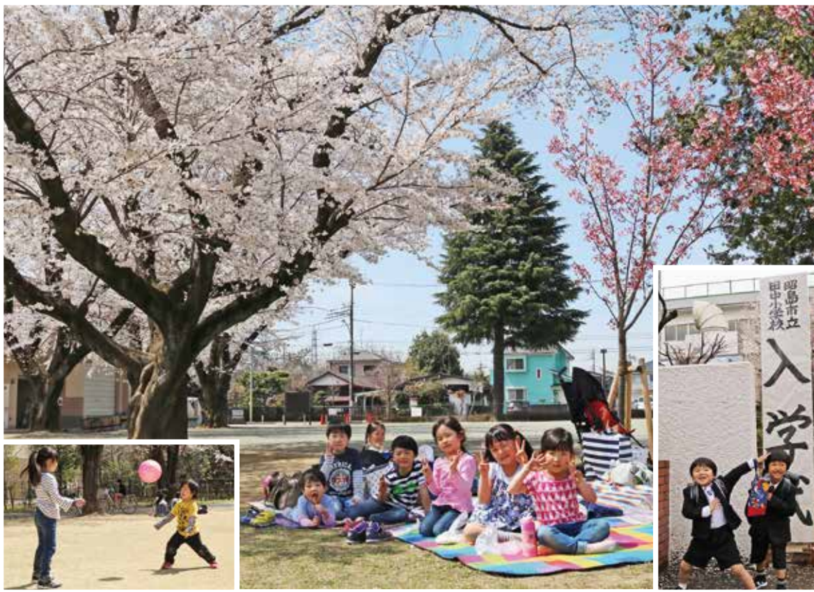
▲春だ。遊んで、遊んで、勉強。 (中・左下：エコ・パーク 右下：入学式)

編集：昭島市議会 議会運営委員会 発行：昭島市議会事務局 〒196-8511 東京都昭島市田中町一丁目17番1号 電話042-544-4476 昭島市ホームページ http://www.city.akishima.lg.jp/