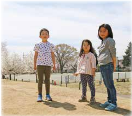
春の大地を踏みしめて (エコ・パーク)