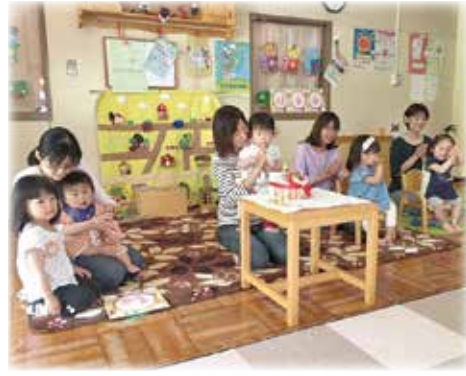
みんなでお誕生会 (子育てひろば ぼりむこう)

質問 食品ロス削減推進法の成立を受け、市においても、食品ロス削減をさらなる市民運動の主流へと押し上げていくことが必要と考 答弁 ①食品ロス削減に向けた取り組みの現状は。②新たな施策等も含め、取り組みを加速すべきと考えるが、所見は。 答弁 ①広報あきしまやリサイクル通信などによる啓発、チラシの全戸配布等に取り組んでおり、平成29年度は可燃ごみ総量で約800トンの減量