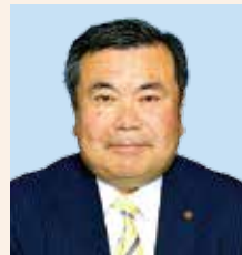
議長 大島 ひろし