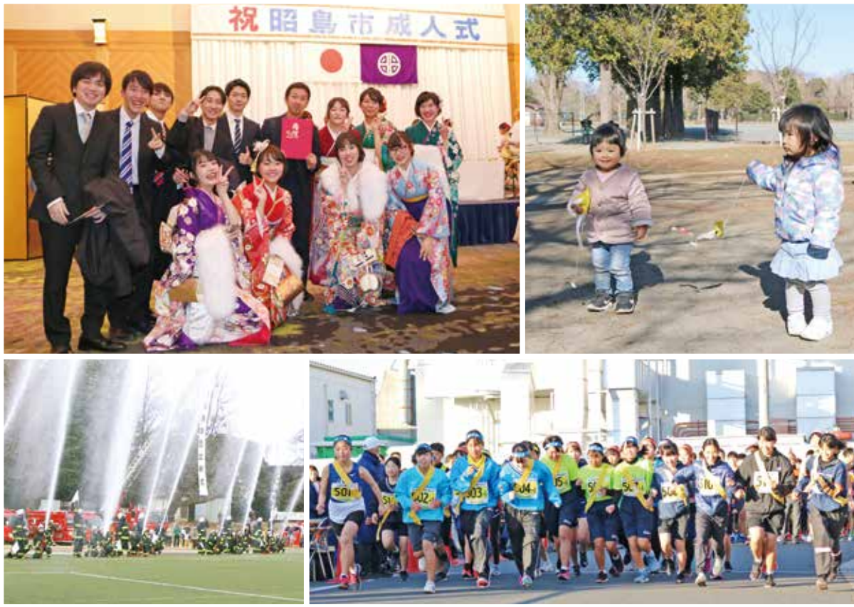
▲令和の新春スタート (左上：成人式 右上：エコ・パークにて 左下：出初式 右下：駅伝大会)

編集：昭島市議会 議会運営委員会 発行：昭島市議会事務局 〒196-8511 東京都昭島市田中町一丁目17番1号 電話042-544-4476 昭島市ホームページ http://www.city.akishima.lg.jp/