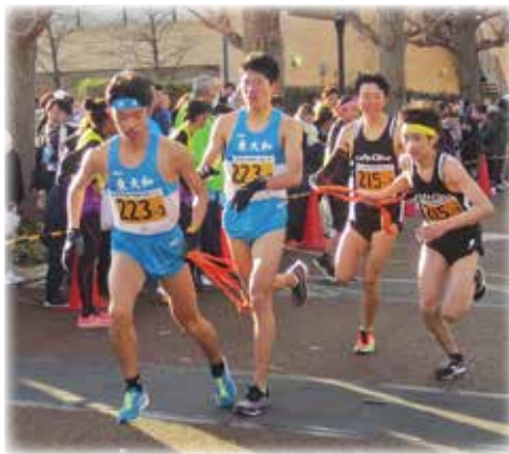
後は頼んだ! (駅伝大会)

質問 地域防災計画上の被害想定では、死者の半数が要配慮者となつている。支援者が、身の危険を感じずに、避難行動の支援ができないように、警戒レベル3について、早期発令をしては。 答弁 ①当該土地の有効活用に向け、どのような活用がふさわしいのか、どのような対応が可能となるのか、調整を図ってきた。②お祭り会場については、先行して使用許可申請の準備をしている。狭隘道路についても、緊急車両の進入や車のすれ違いが可能となるよう努めていく。