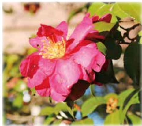
冬の寒さにも負けず (市役所に咲くサザンカ)