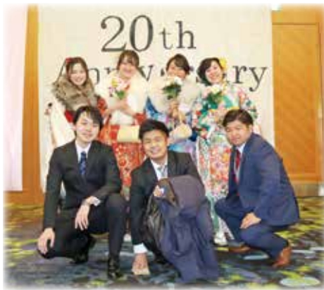
おめでとう。(成人式)

質問 介護保険法改正について、国では介護負担のさらなる見直しや要介護1・2の総合事業への移行などが議論されている。 ①市の見解は。②移行により単価が下がることで、事業者が撤退するのでは。③介護職人の確保・育成についての考えは。④介護職養成講座の無料実施等を行っている。 答弁 ①持続可能で安定的な制度とすべく検討が進められており、国での議論の推移を注視している。②事