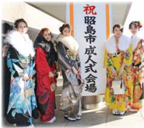
祝 昭島市成人式会場 (成人式)