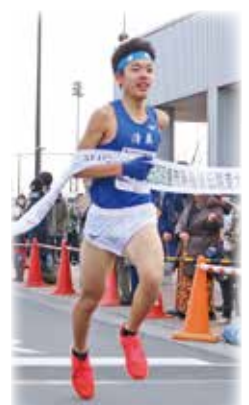
応援を力に変えて(駅伝大会)

質問 教育現場でのいじめ道による、市の対応は。① 小中学校や高校の暴力行為、いじめの認知件数は平成30年度、過去最多で、特に小学校低学年が多い。市立学校の暴力行為の状況は。またいじめ、暴力行為の防止策は。② 神戸市の教員間でのいじめ問題があった。いじめはいけないと指導すべき立場の教員たちの行動や、学校責任者である校長が、この件を早期対応に努めている。③ 校長会で教員間のいじめに関する危機管理マネジメントについて指導した。また、健康診断において、質問票を周知し、教職員が直接回答できるようにしている。④ 厚生労働省は令和2年度にフレイル健診を導入