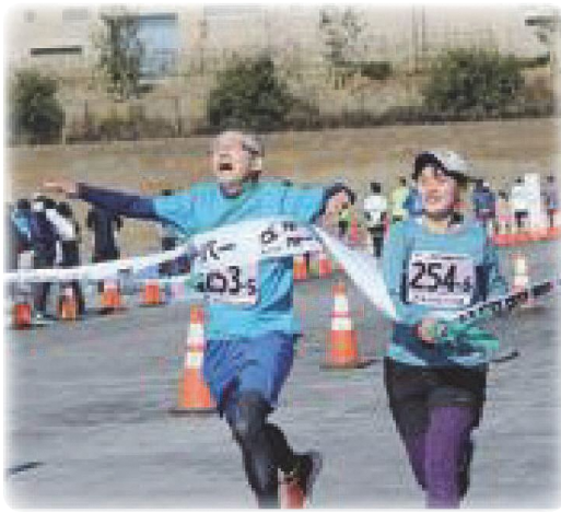
ゴール!! (駅伝競走大会)

質問 中学校の部活動について、生徒数の減少、学校の部活動以外を選択する生徒の増加や指導者の人材確保など、部活動の維持が難しくなっていることが問題となっているのか。 答弁 ①今年度中に地域移行が打ち出された学校の働き方改革を踏まえた部活動改革の中で、6年までのスケジュールが示されているが、⑤年度以降、段階的に実施が望まれている部活動の地域移行について、部活動改革のスケジュールを踏ま 質問 中神駅北側地域は区画整理事業により、駅前広場が完成し、利便性が向上した。事業の今後について、①駅前ブロックに面している市の事業用地に複合施設を建設し、都に交番誘致を要請する考えは。 ② 市民との情報共有として、計画道路、現道、道路整備事業の予定道路がホームページで一目でわかるようにしては。 答弁 ①当該地は交番を含め、自治会等から要望が出されている。引き続き住民