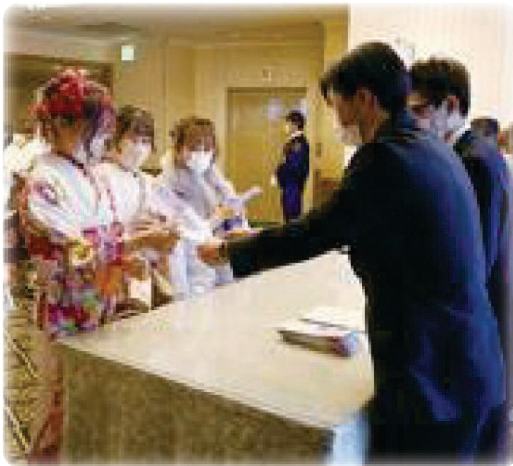
希望の船出 (はたちのつどい)

質問 清掃センターについて、焼却炉を交互に使用するなど安定稼働を行っているが、施設建設後28年が経過しており、可燃ごみ処理の方向性を早期に決める時期と考える。市の考えは。 答弁 市内での部活性プロジェクトで調査・研究したほか、基本調査を実施した。令和5年度中を目途とする新処理計画の方針決定に向け、検討を加速化、具