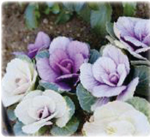
早春の訪れ (葉ぼたん)

質問 学校教育における諸問題について、2006年の教育基本法の改正や小学校での英語教育など、現場が目まぐるしく変化する中、将来を担う子どもたちを育てる教員が、疲弊から抜け出せない状況にある。改善は必至と考えるが、①タブレット端末の活用状況は。②教員の働き方改革への取り組みは。③長時間労働を解消し、児童・生徒の働き方改革への取り組みは。④配置増をすべき。 答弁 ①検索エンジンを活用した調べ学習やグループワーク機能など、効果的な活用を努めている。②来年度、夏季休業期間中の学校閉庁日を増加することについて、学校と調整を進めていく。 質問 米軍横田基地問題について、①CVI-22オスプレイはクラッチ部に欠陥がある。抜本的改善のない中で訓練は中止すべき。②心身に被害があるとされる低周波音の測定を市が独自に行うべき。 答弁 ①より一層高まる住民の不安を解消するため、更なる説明責任を果たすよう、国及び米軍に対し、強く要請した。②国の責任において調査・検討し、対策を講じるよう要請している。