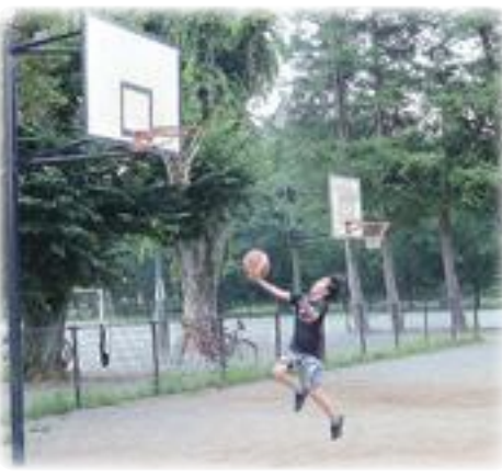
シュート! (エコパーク)