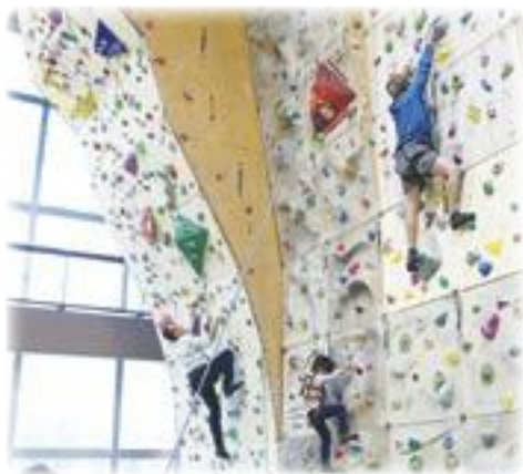
スポーツの秋 (市民スポーツ・レクリエーションフェスティバル2023)

質問 美観と安全性を意識したまちづくりについて、①市内各所で見受けられるインターロッキング舗装は、美観として申し分ないが、水道等の地下埋設物工事後の補修をインターロッキング舗装に戻さない場合がある。理由は。②補修により段差が生じ、ベビーカー等が転倒する危険がある。段差を最小限にした補修工事への考えは。③江戸街道の植栽の雑草等が車道側にはみ出ており、処理が必要と考える。所見は。④昭島駅周辺の野鳥対策について、鳴き声やふん害への対策として、野鳥撃退器具等を用いた飛来防止策を行つては 答弁 ①復旧範囲が狭小の