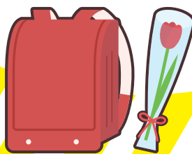
入学祝い・卒業祝い