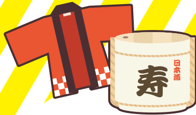
お祭りへの寄附や差し入れ