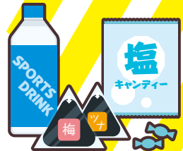
運動会やスポーツ大会への 飲食物の差し入れ