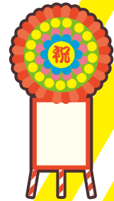
落成式・開店祝いの花輪