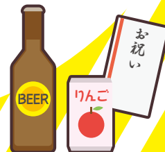
町会の集会や旅行等の 催し物への寄附や 飲食物の差し入れ